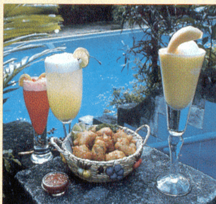
Bahamas Drinks am Pool Bahamas drinks at the pool

On a more real and present-day level are the culinary pleasures in the "Graycliff Company". A very proper "bistro", with an excellent cuisine for in between and all other purposes, was established here, for the visitor who feels that the short footpath over a romantic bridge to the Graycliff restaurant takes too much effort after many drinks.