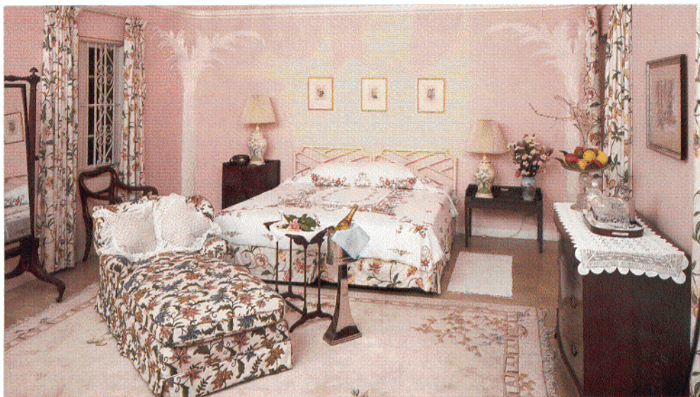
Das Old Mansion Haus hat 14 elegante Zimmer, jedes in einem anderen Interior-Stil